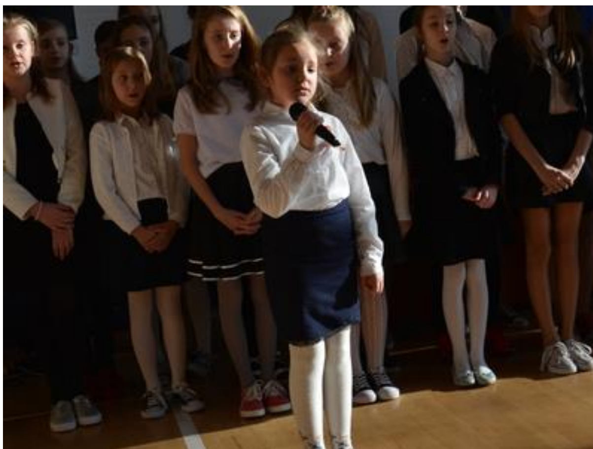
Montaż poetycko-muzyczny „Bóg – Honor – Ojczyzna”