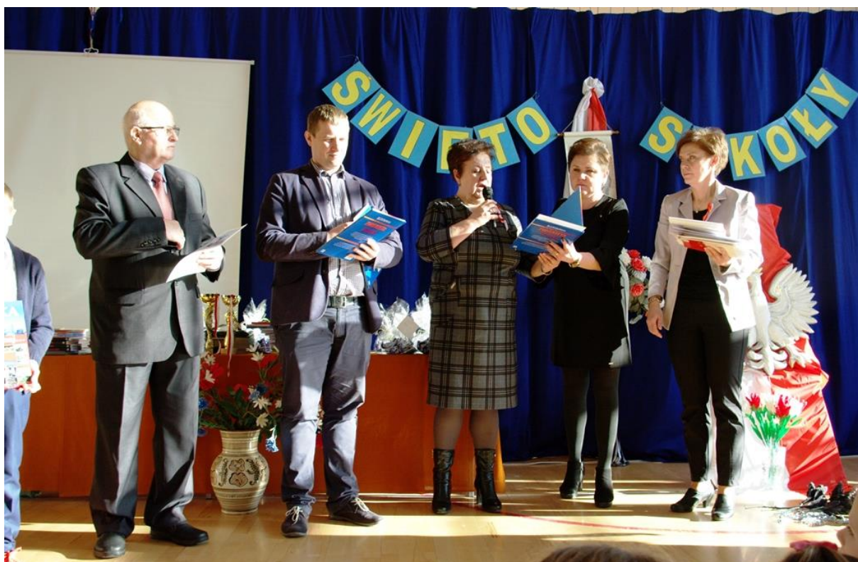
Zaproszeni goście i pani dyrektor wręczają nagrody zwycięzcom konkursów.