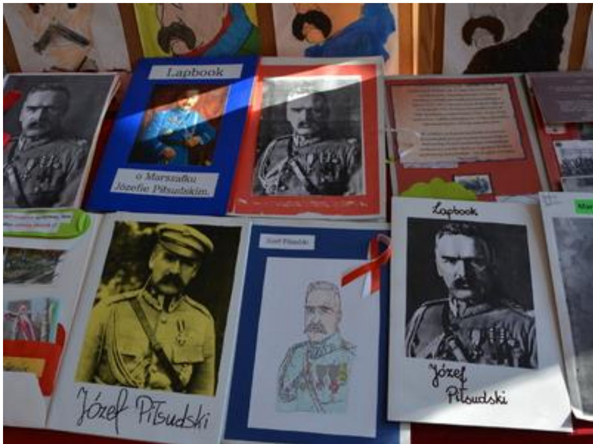
Wystawa prac plastycznych i lapbooków