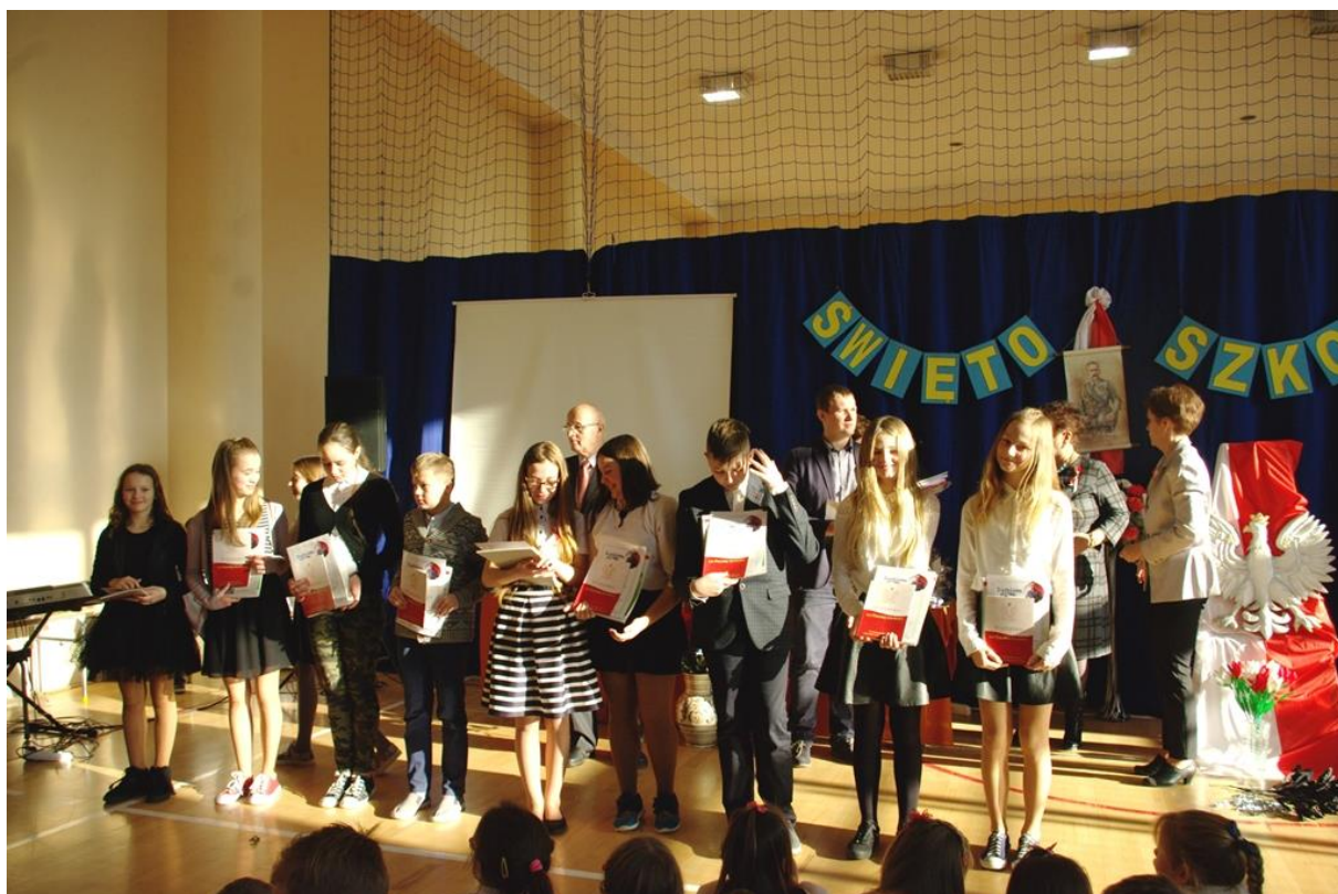
Uczniowie klas 4-7 nagrodzeni w konkursie na najładniejszy lapbook