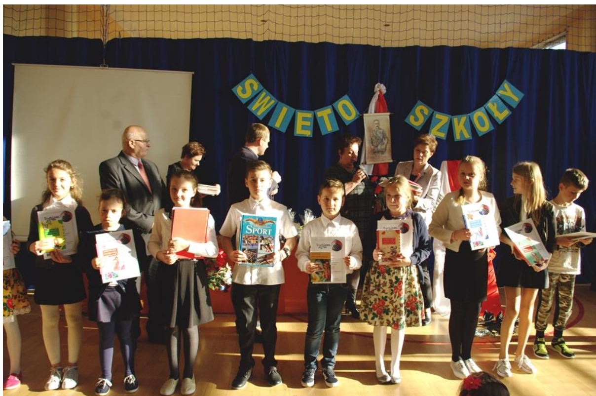
Uczniowie klas 1-3 nagrodzeni w konkursie na najładniejszy lapbook