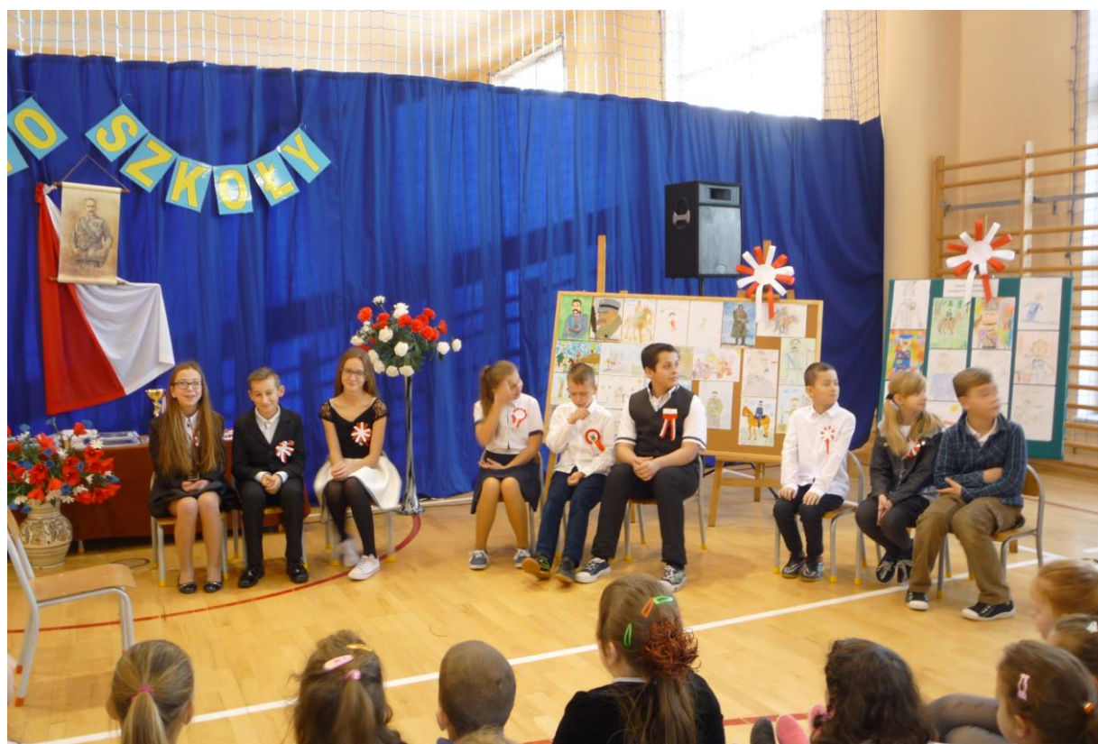
Turniej wiedzy o Józefie Piłsudskim