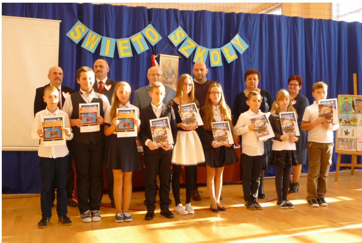
Zwycięzcy turnieju wiedzy o Józefie Piłsudskim

Oprócz zwycięzców turnieju wiedzy i konkursu pieśni legionowych wszyscy zebrani poznali nazwiska nagrodzonych w dwóch konkursach: plastycznym i poetyckim pod hasłem „Józef Piłsudski-patron naszej szkoły”. Konkurs plastyczny cieszył się dużym zainteresowaniem, bo złożono aż 85 prac wykonanych różnymi technikami. Na konkurs poetycki wpłynęło 8 wierszy.