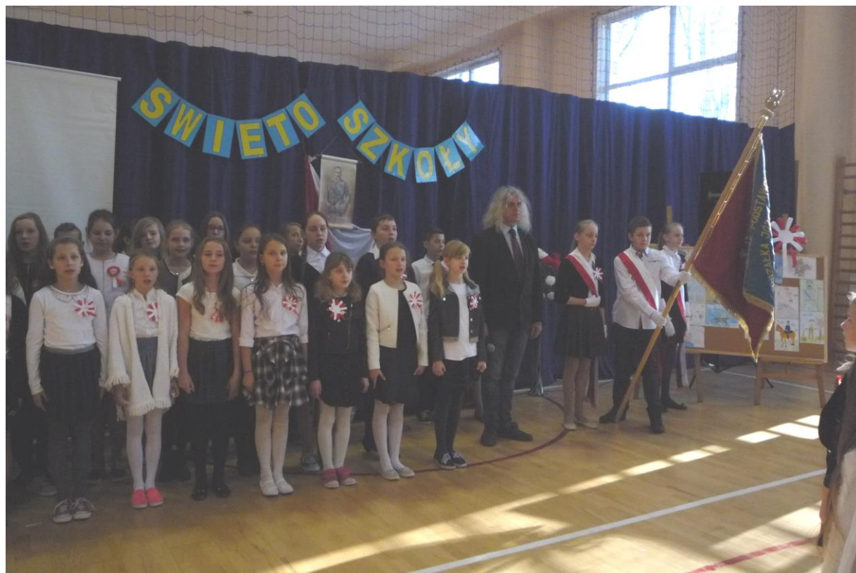
Montaż słowno-muzyczny „Niepodległość – trudne słowo”