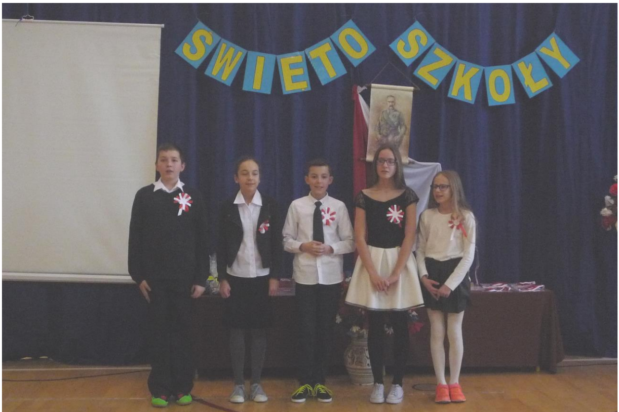
Konkurs pieśni legionowych