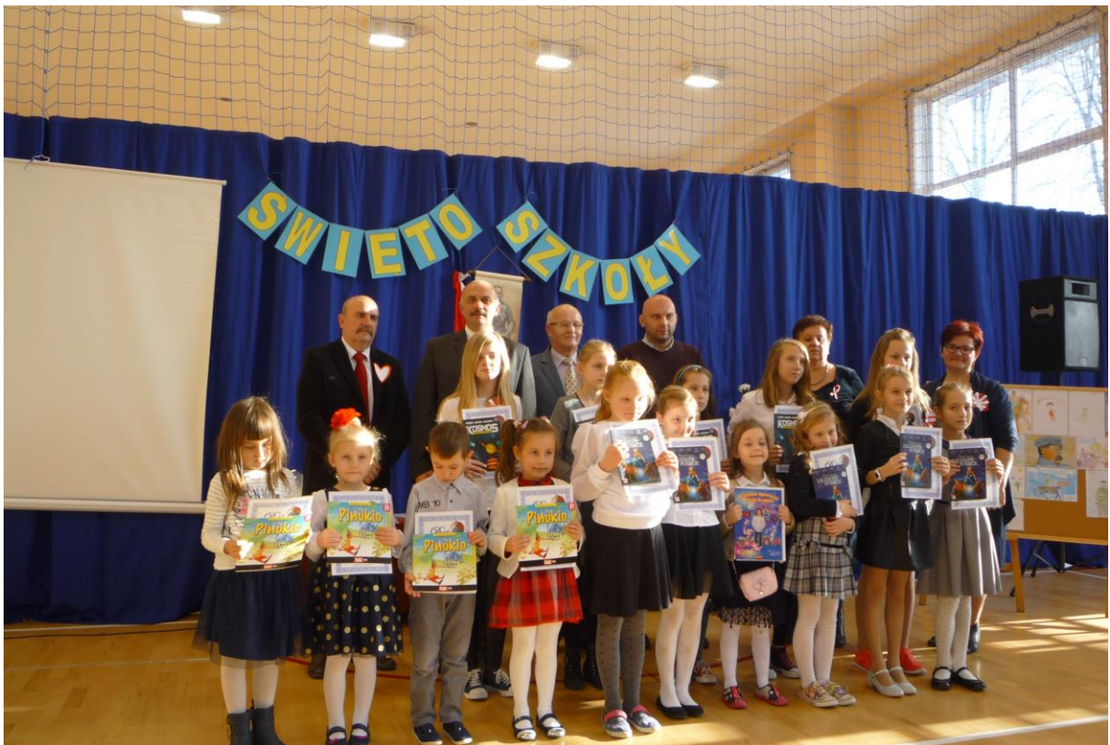
Zwycięzcy konkursu plastycznego