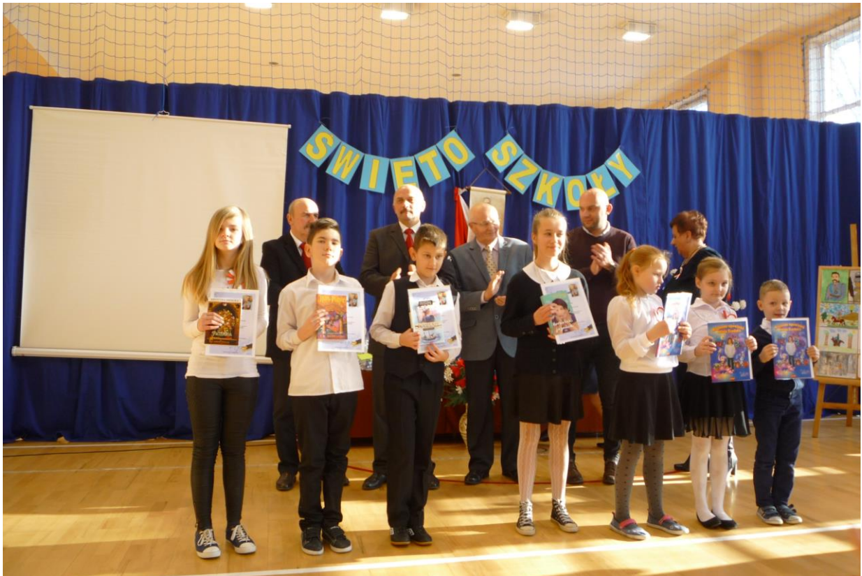
Zwycięzcy konkursu poetyckiego

Ogłoszono również zwycięzców Turnieju Tenisa Stołowego o Puchar Dyrektora Szkoły. Dyplomy, puchary i medale otrzymali: