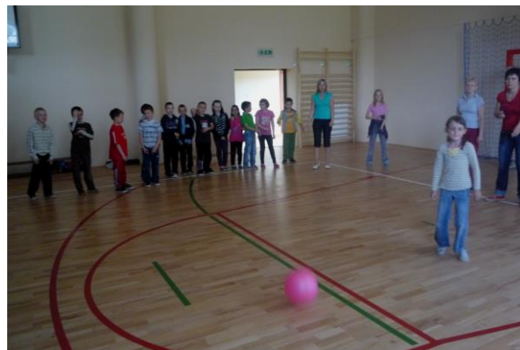
Mecz siatkówki i zabawa w „dwa ognie”