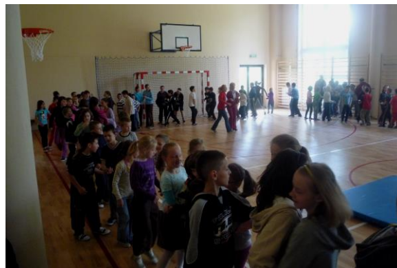
Integracyjny taniec belgijski