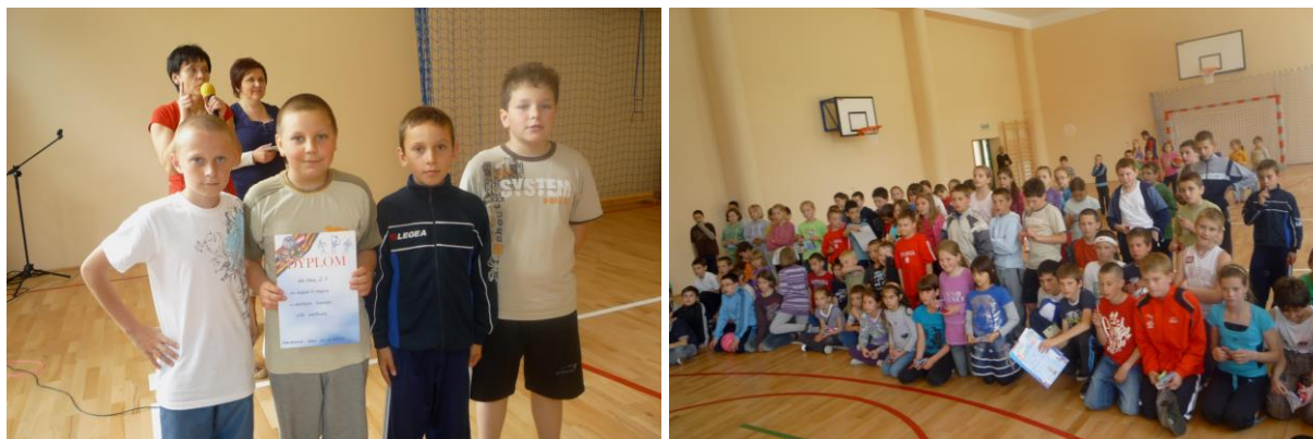
Wręczenie dyplomów i nagród

zasady fair play. Następnie wręczyła nagrody indywidualne i zespołowe za konkursy, mecz siatkówki i inne konkurencje sportowe. Uczniowie, którzy uczestniczyli w kilku konkursach otrzymali specjalne dyplomy za aktywny udział w 10. jubileuszowej kampanii „Zachowaj Trzeźwy Umysł 2010”. Dzieci bardzo ucieszyły się z otrzymanych nagród. Radość była tym większa, iż nagrodzeni zostali nie tylko zwycięzcy poszczególnych konkurencji, ale wszyscy uczestnicy kampanii. Nagrodzenie tak licznej grupy uczniów było możliwe dzięki hojnemu wsparciu finansowemu, które zostało nam udzielone przez Urząd Gminy w Chełmcu.