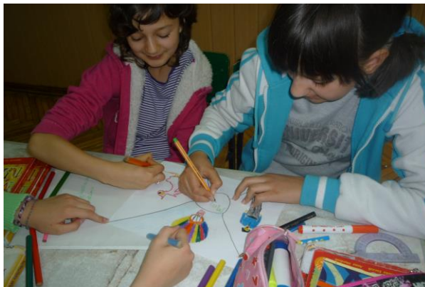
Konkurs plastyczny „Życzę sobie”

Finał kampanii „Zachowaj Trzeźwy Umysł” odbył się w naszej szkole 2 czerwca 2010 r. Pogoda niestety nie dopisała i zabawy musiały się odbyć w budynku szkoły. Nie zasmuciło nas to jednak, bo bardzo chcieliśmy „wypróbować” nową salę gimnastyczną. Uroczystość poświęcenia i oddania sali do użytku odbyła się bowiem dzień wcześniej, tzn. 1 czerwca. Wszyscy uczniowie z radością zgromadzili się w pięknej i ogromnej sali. Tam na rozpoczęcie imprezy cała społeczność szkolna (również nauczyciele) wykonała belgijski taniec integracyjny. Było wiele śmiechu, muzyki i płaśów. Potem rozegrano pierwszy na sali mecz siatkówki. Pozostali uczniowie dopingowali i zagrzewali do walki. Zwycięską okazała się drużyna chłopców z klasy 6b. Dla dzieci z klas 1-3 zorganizowane były zabawy ruchowe. Dużo radości sprawiła im zabawa w „dwa ognie”.