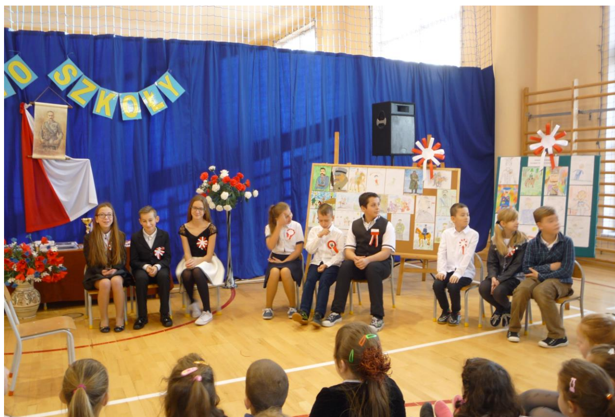
Turniej wiedzy o Józefie Piłsudskim