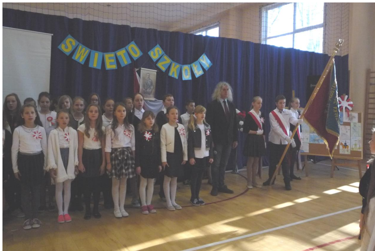
Montaż słowno-muzyczny „Niepodległość – trudne słowo”