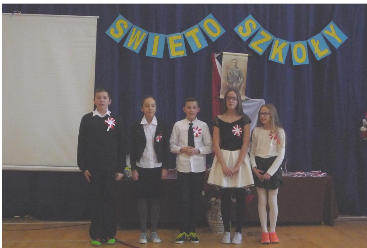
Konkurs pieśni legionowych